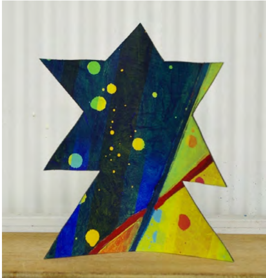
佐藤克久「星の木」 水彩・アクリル・キャンバス・厚紙 23×19.5×4.5cm 2010