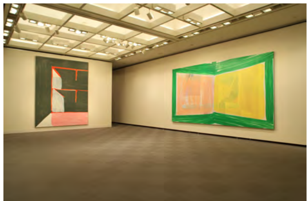
登山博文 あいちトリエンナーレ 2010 展示風景 左：「空の間」 アクリルウレタン・キャンバス 420×315cm 2010 右：「左と右」 アクリルウレタン・キャンバス 300×553cm 2010